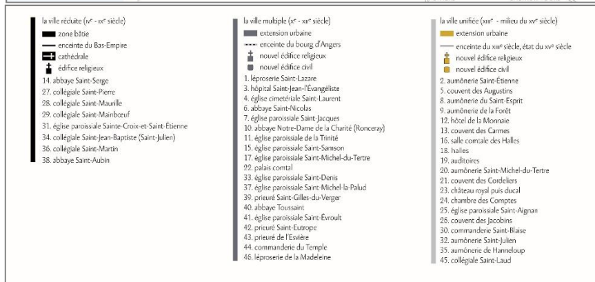
Synthèse de l'évolution urbaine de la ville d'Angers au Moyen Age (300-1450) © Virginie Desvigne