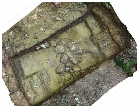
Diagnostic numérisé et géolocalisé de la fouille du fossé.