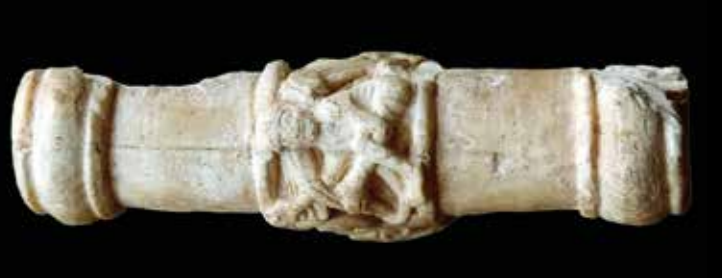
Tau des abbés de Landévennec, photo : Annie Bardel / Coll. Musée de l'ancienne abbaye, acquis avec l'aide du FRAM.