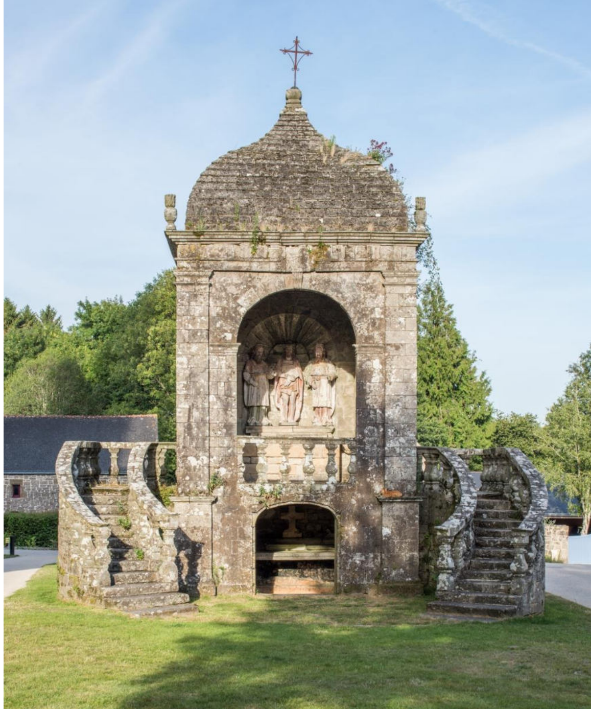
Guern (56), Scala sancta de Notre-Dame de Quelven