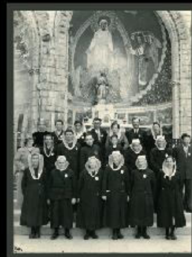
PHOTOS DE PÈLERINAGE // 1935