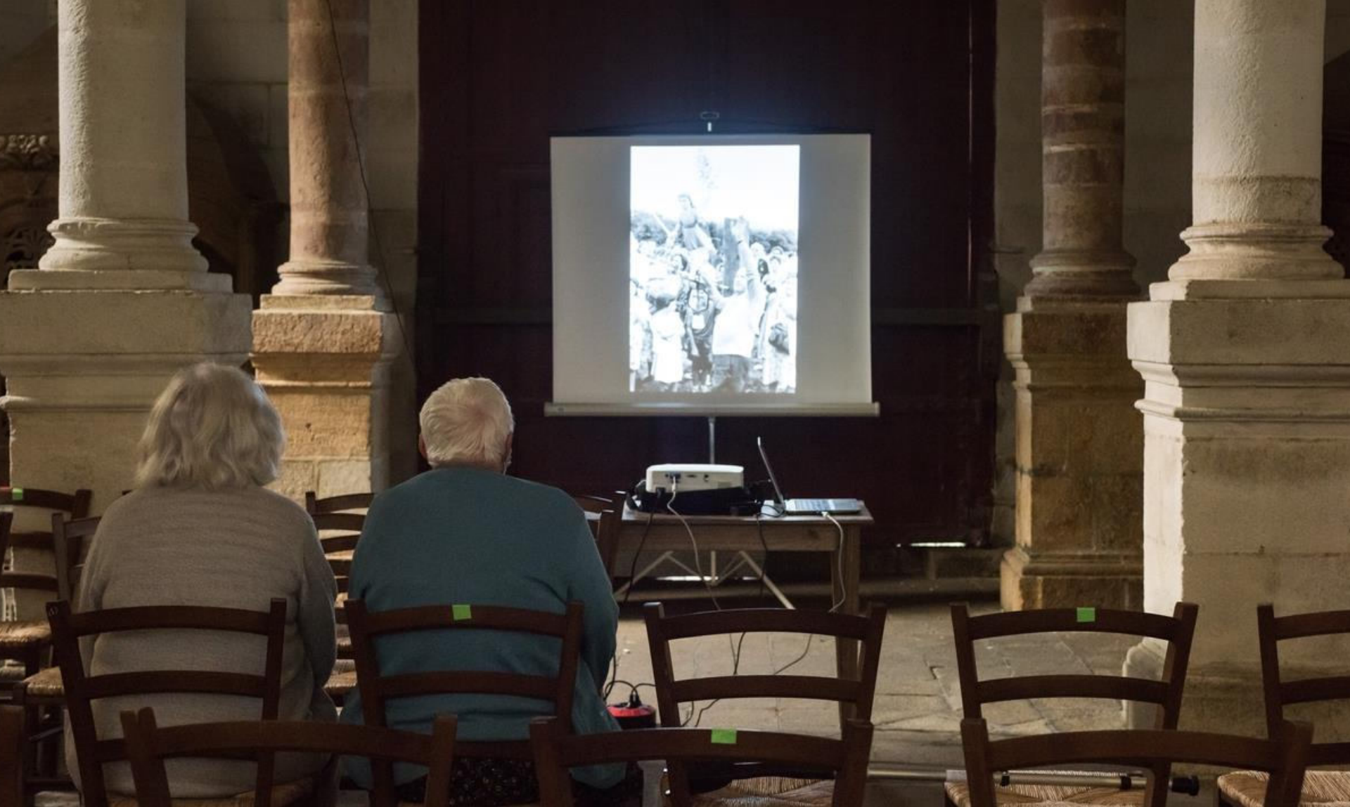
Guern (56), Notre-Dame de Quelven, Journées du patrimoine 2020