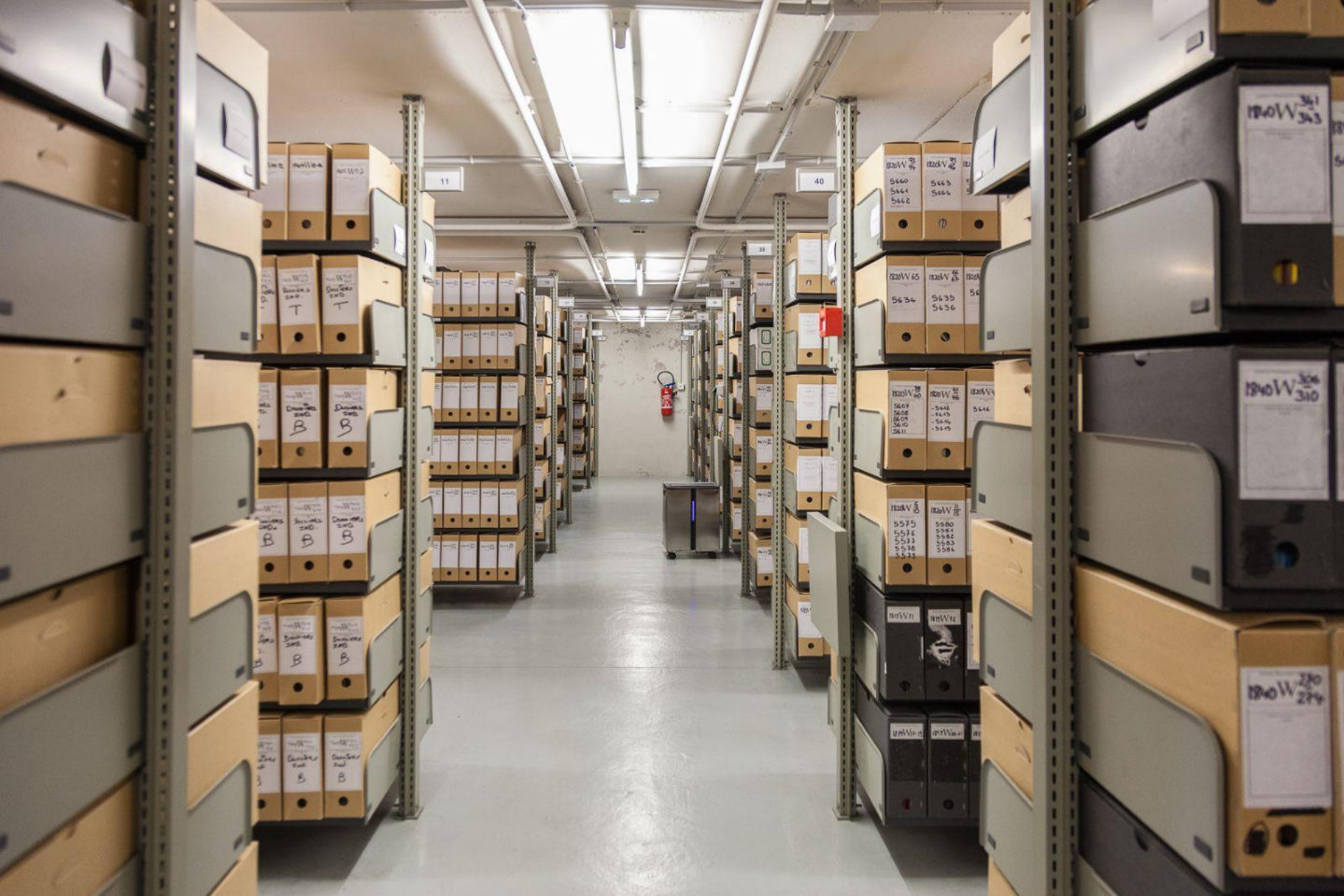
Archives municipales de Rennes, magasin de conservation éclairé, Distillerie nouvelle, 2016