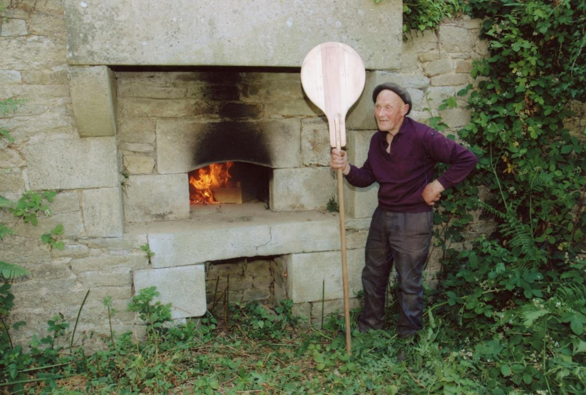
Four de Kerivoal, Plomelin (29), photo Pierre Le Guiriec, 2010