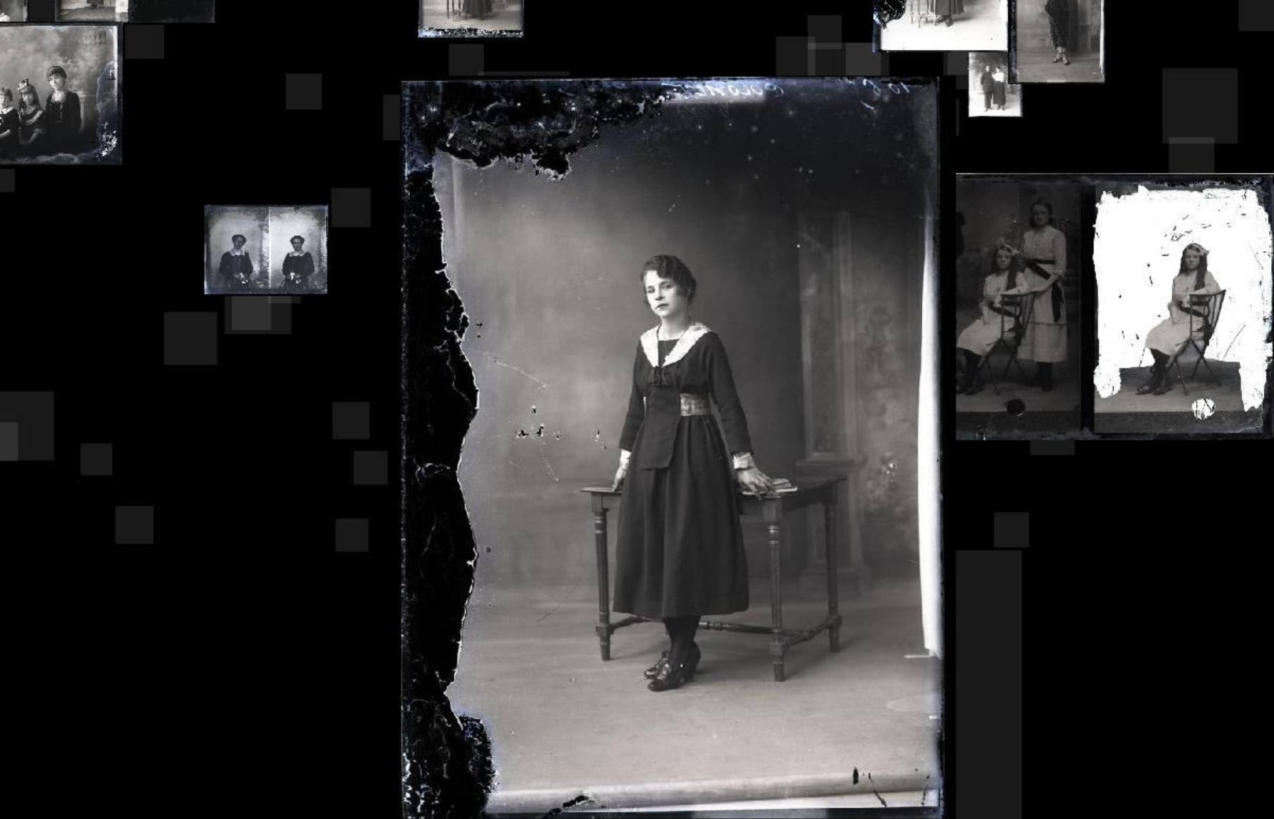
Portrait(s)...commande(s) à Lucien Bailly, Musée d'art et d'histoire de Saint-Brieuc.