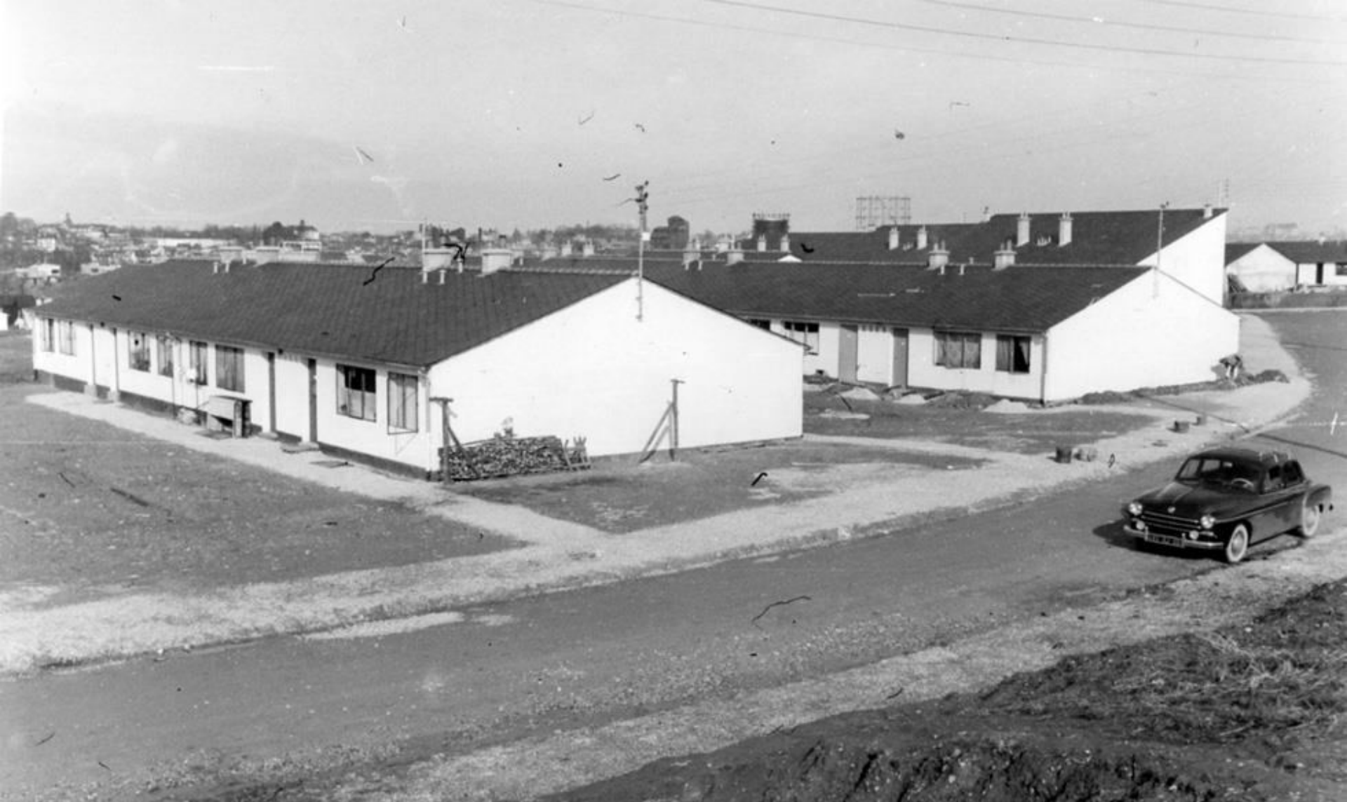
Construction de la cité d'urgence de Cleunay, 1960 (Archives de Rennes, 350 Fi 241)