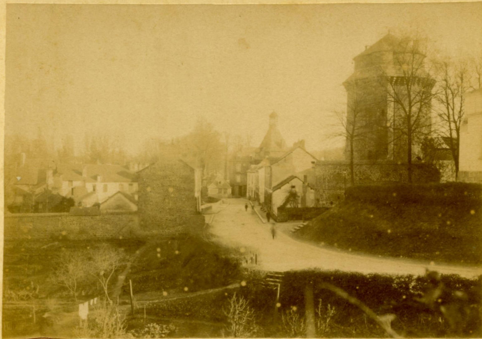
Montfort sur Meu