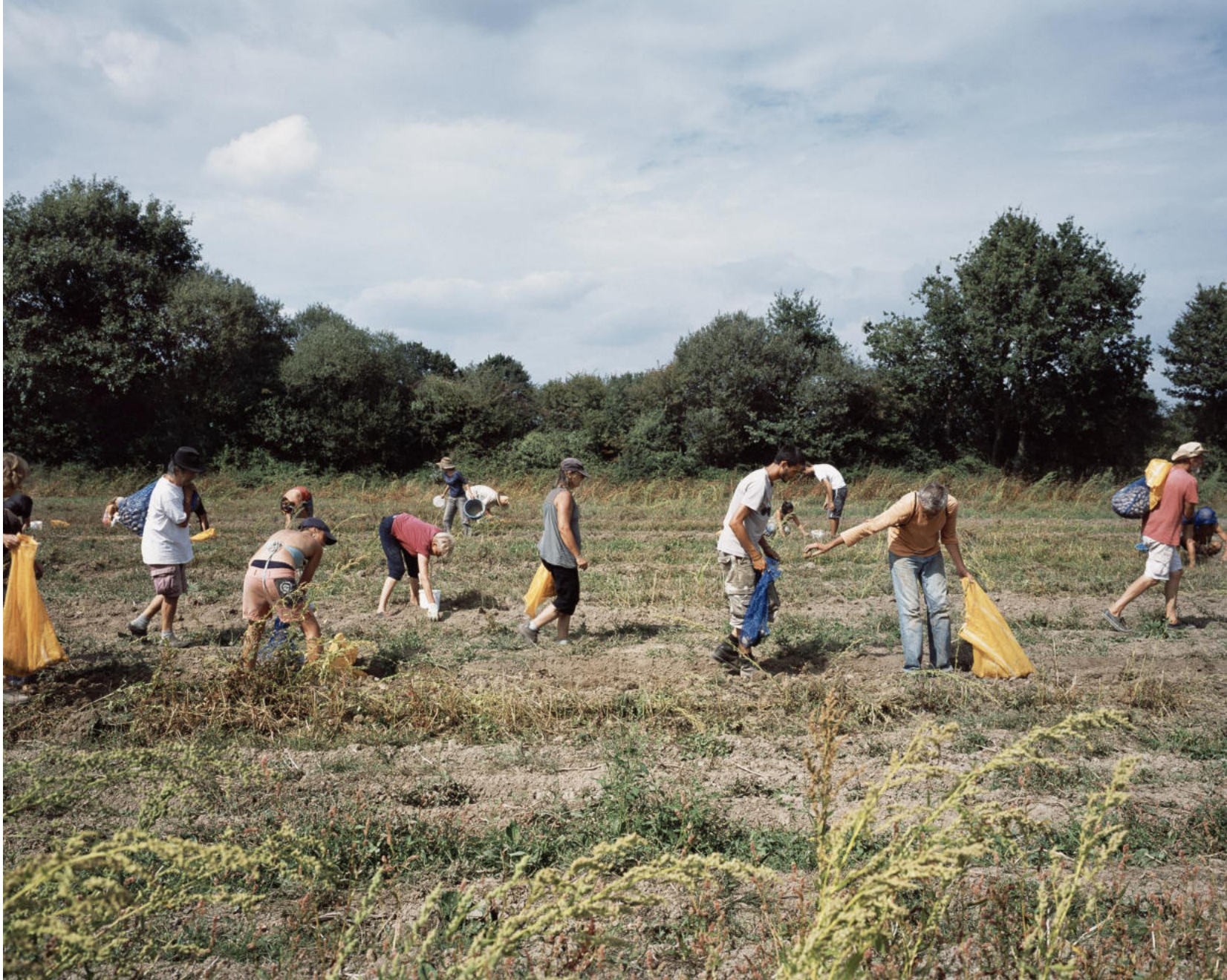
Bruno Serralongue - Air de Paris, La récolte de pommes de terre aux Rosiers, ZAD de Notre-Dame-des-Landes, samedi 6 septembre 2014, Frac Bretagne.