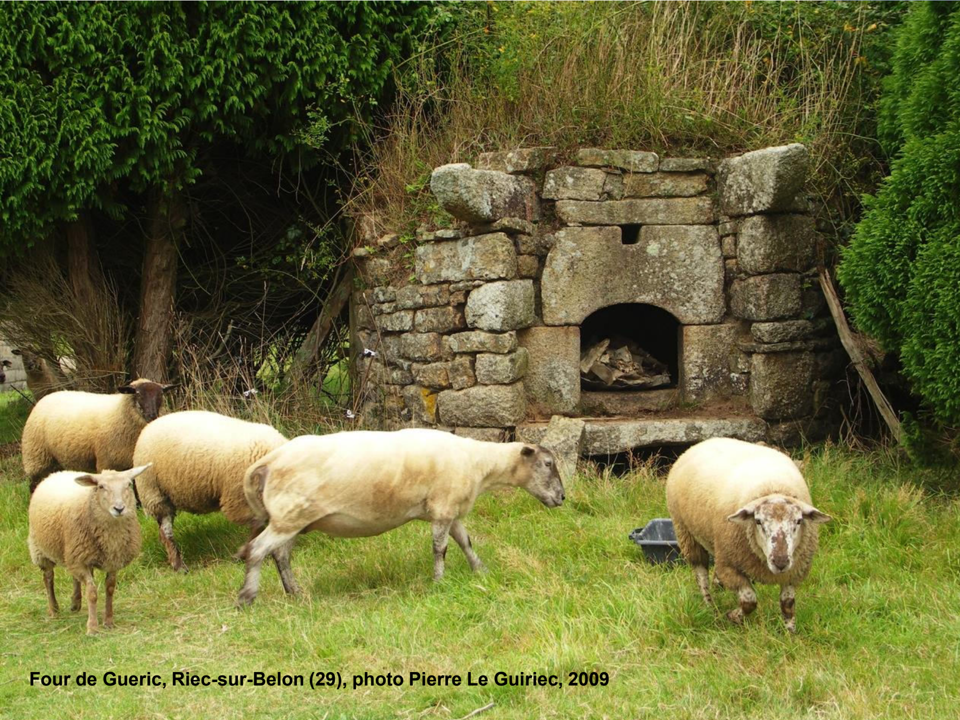
Four de Gueric, Riec-sur-Belon (29), photo Pierre Le Guiriec, 2009