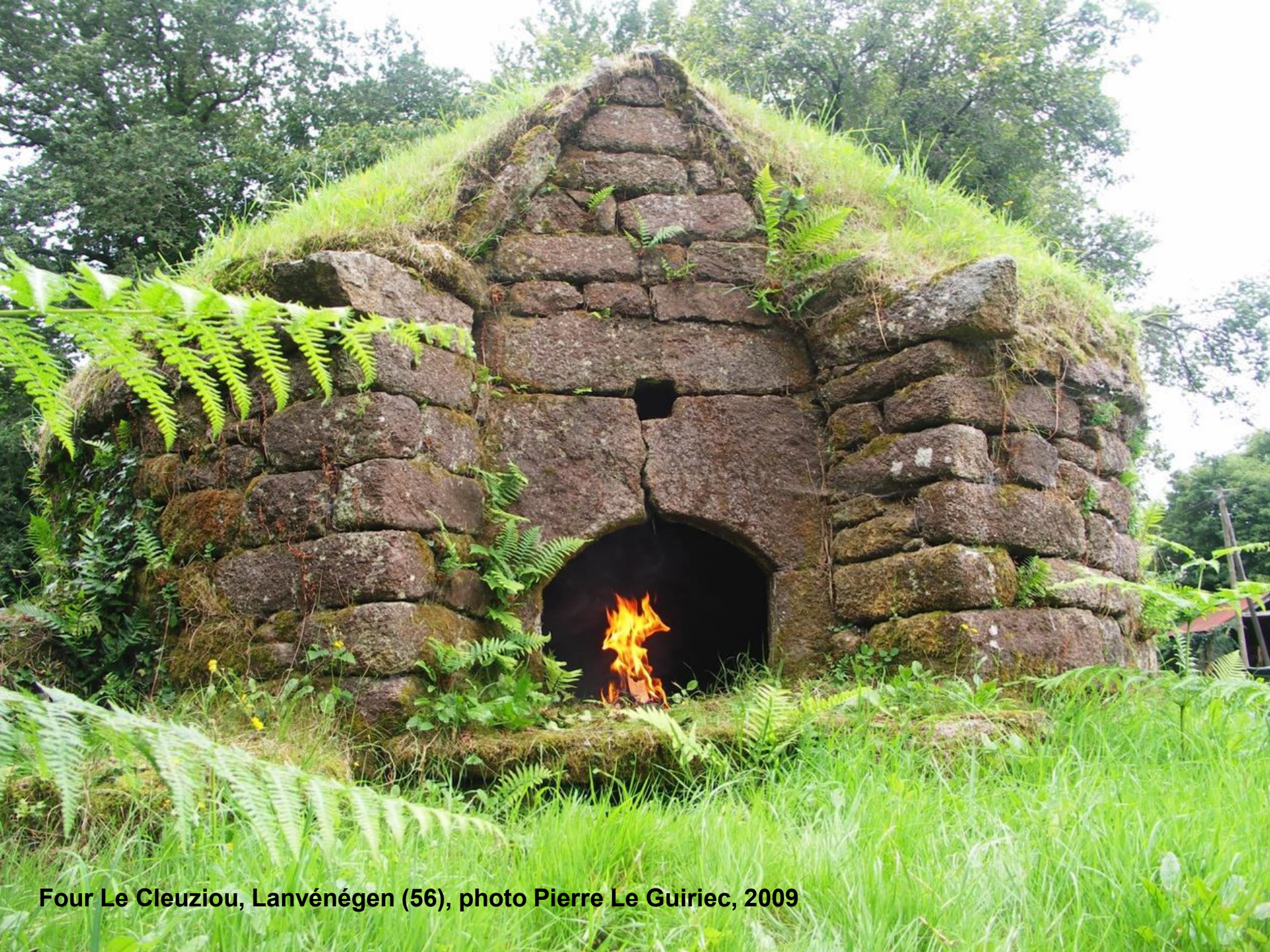
Four Le Cleuziou, Lanvéne gen (56), photo Pierre Le Guiriec, 2009