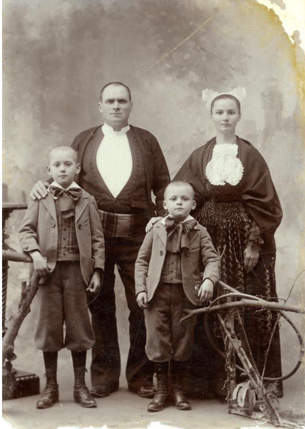
Kenleur – photos anciennes collectées puis recolorisées 2021