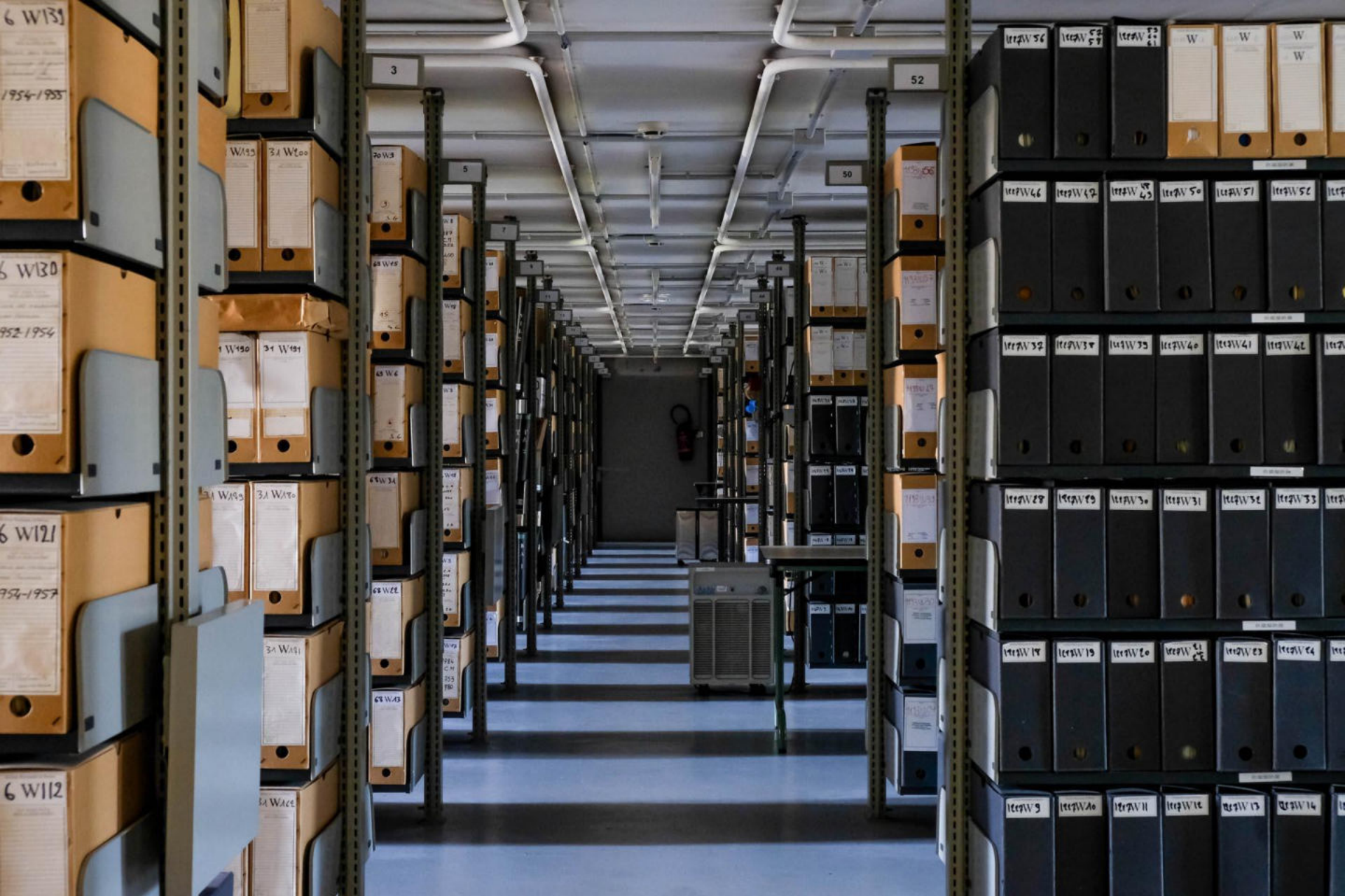
Archives municipales de Rennes, magasin de conservation éteint, photo Candice Hazouard, 2019