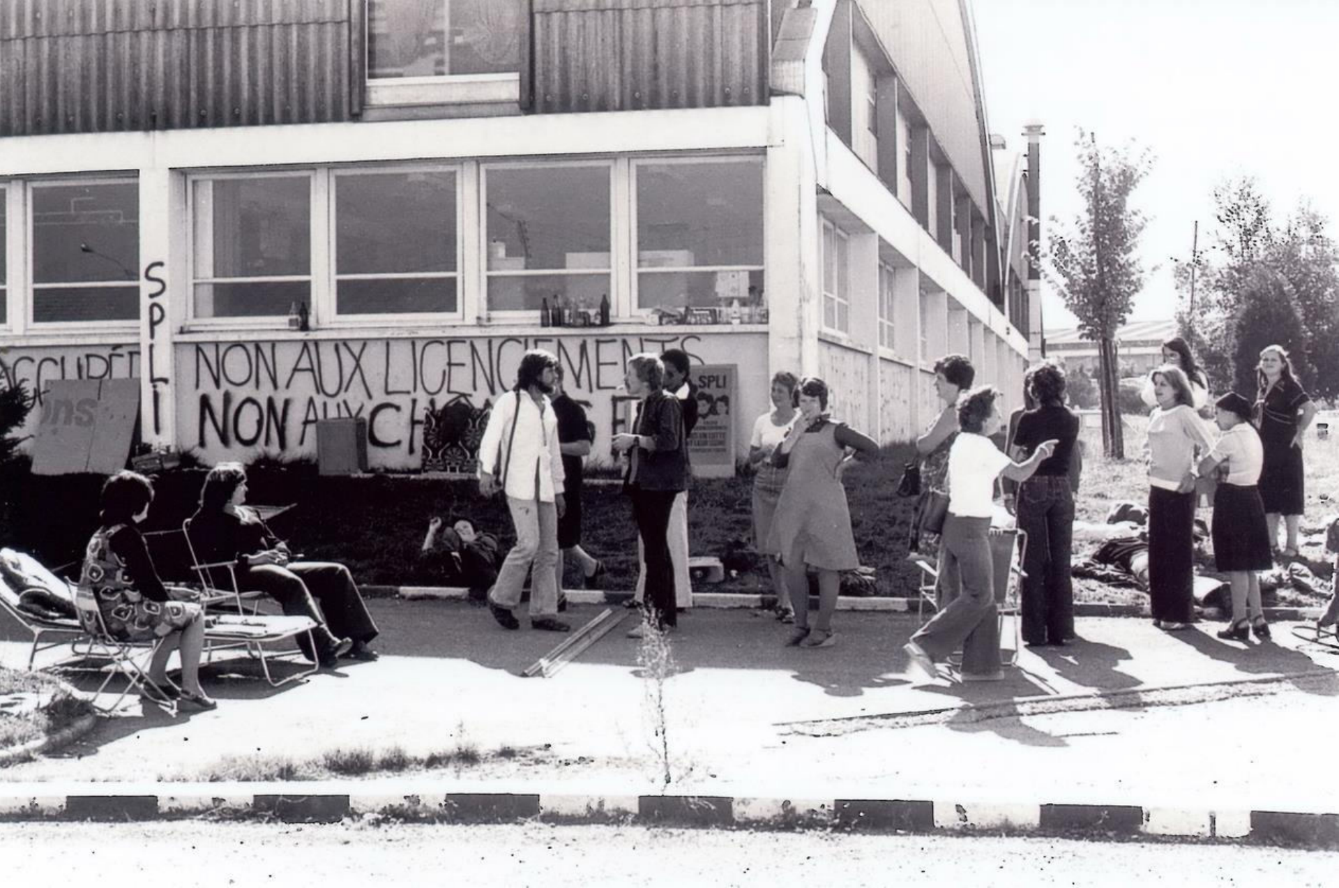
Mobilisation des ouvrières de la Société parisienne de lingerie indémaillable (SPLI) et occupation de l'usine, 1978 (Archives de Rennes, 58 Z 9, fonds Lorient)