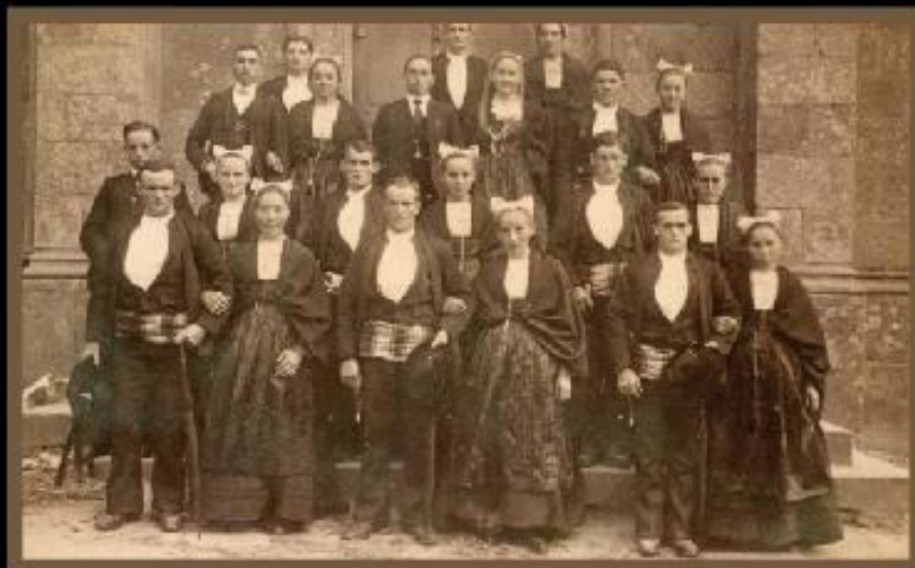
PHOTOS DE NOCES // 1913